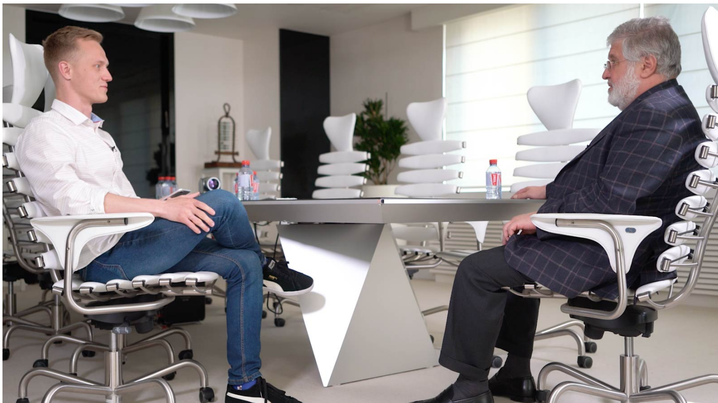
Коломойский: "Надо понять, что Петя (Порошенко) уже всем надоел"

Мы обсуждаем контент, но это не связано с ТСН.